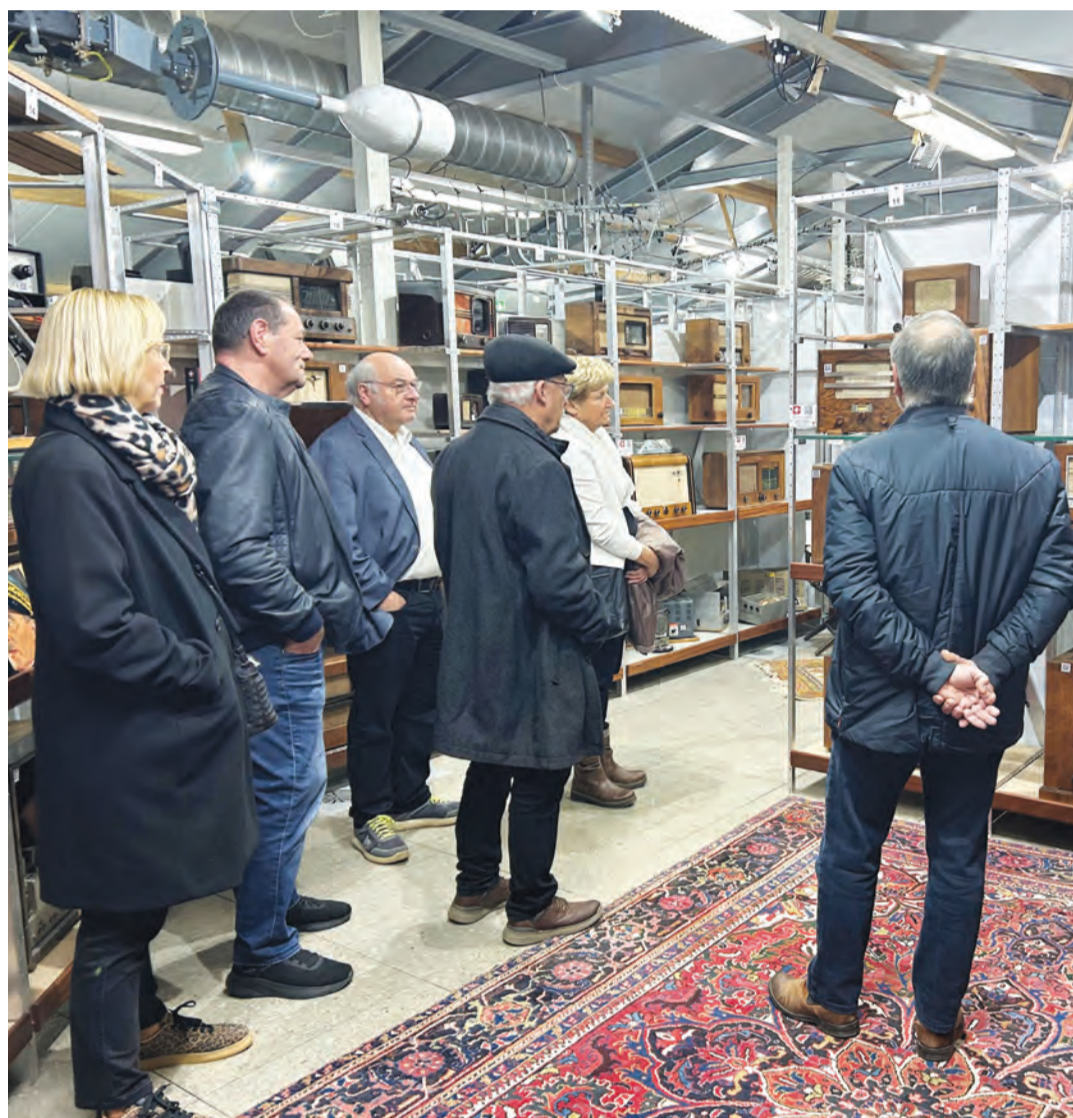
Die Kommission Ortsmuseum war am Montag zu Besuch im Radiomuseum Seger in Bischofszell.

Nach der kulturellen Fortbildung im Radiomuseum ging der Abend für die Mitglieder