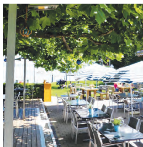
Blick über die Terrasse des Restaurants.