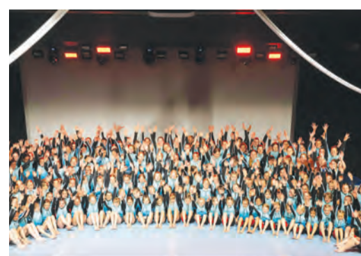
Der TSV Co-Dance bedankt sich bei allen.