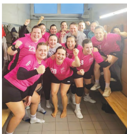
Das Frauen 2 jubelt in Flawil.

Handball Am vergangenen Wochenende wurden die letzten Handballspiele des Kalenderjahres ausgetragen. Während die Juniorinnen und Junioren in der Zwischenzeit fleissig weiter trainierten und die Adventszeit mit einem gemeinsamen Pizzaplausch feierten, spielten die aktiven Mannschaften am dritten Adventswochenende. Das Frauen 1 lieferte sich gegen die zweitplatzierten der Tabelle, die SG Wyland 1, ein spannendes Spiel. Bisher konnten die Gegnerinnen nicht bezwungen werden. Die erste Viertelstunde war von einem so schnellen Spiel geprägt, dass selbst die Amriswilerinnen von der eigenen Leistung überrascht waren. Leider konnte die Leistung nicht aufrecht erhalten werden. Es schlichen sich viele technische Fehler ein und die Tore wollten nicht mehr gelingen. Nach einer zermürbenden zweiten Halbzeit reiste das Frauen 1 mit einer Niederlage ab (19:28). Das Frauen 2 konnte das letzte Spiel der ersten Saisonhälfte für sich entscheiden. In einem ausgeglichenen Spiel konnten sich die Amriswilerinnen zum Ende hin durchsetzen und zwei Siegespunkte auf ihrem Konto verbuchen (30:26). Am Sonntag spielte das Herren 2 gegen den BSV Bischofszell 2. In ihrer letzten Partie konnten sie leider keinen Sieg mehr verzeichnen (29:25). Der Handballclub Amriswil wünscht eine besinnliche Weihnachtszeit und freut sich darauf, im Jahr 2026 altbekannte und neue Gesichter in der Halle zu sehen.