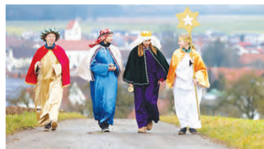
Die Sternsinger sind bald wieder unterwegs.