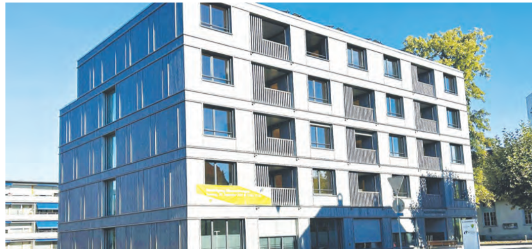
Die neuen Alterswohnungen konnten am 20. September feierlich eröffnet und eingeweiht werden.

Das Bauvorhaben wurde gemäss RLC Architekten AG mit der letzten eingegangenen Rechnung vom 19. November 2025 formell abgeschlossen. Die Gesamtkosten für das eigentliche Bauprojekt belaufen sich somit auf gut 14'995'000 Franken. Hinzu kommen die Kosten des Vorprojekts in der Höhe von 280'579 Franken, was zu Gesamtinvestitionen von gut 15'275'000 Franken, inklusive Kunst am Bau, führt. Der revidierte Kostenvoranschlag wurde somit um gut 1'324'000 Franken unterschritten, was einer Abweichung von 8.0% entspricht. Das Controlling erfolgte durch die Finanzverwaltung. Dabei wurde die Baukostenabrechnung quartalsweise mit der Buchhaltung des APZ abgeglichen. Dank der sehr sorgfältigen und transparenten Buchführung seitens des APZ konnten keinerlei Abweichungen festge-