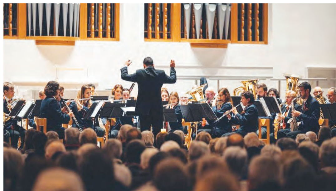
Die Stadtharmonie Amriswil sorgt am städtischen Neujahrsapéro für musikalische Unterhaltung.

Unter dem Motto «Musik, Freunde, Momente», das die Stadtharmonie nicht nur während des Jubiläumsjahres, sondern bereits seit der Gründung vor 150 Jahren begleitet, wird die Formation durch das Jahr 2026 musizieren. So stehen neben den Konzerten am Neujahrsapéro zwei