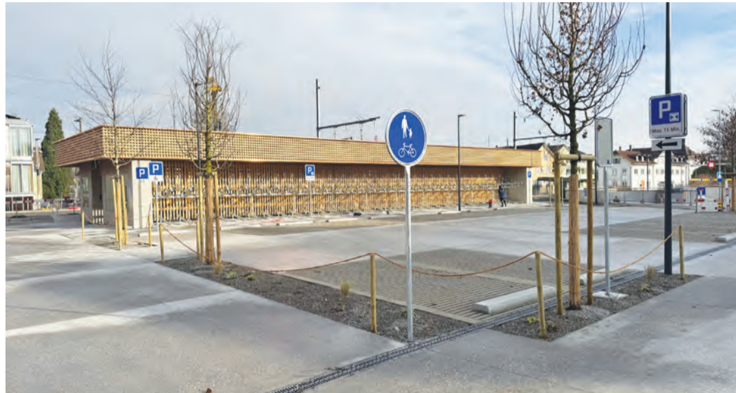
Mit der Eröffnung der neuen Veloparkierung wird die erste Bauetappe beim Bahnhof bald abgeschlossen.