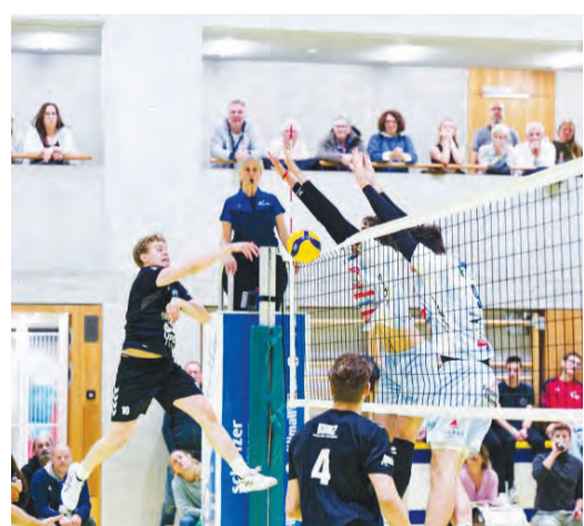
Amriswil siegt gegen Chênois in Genf.