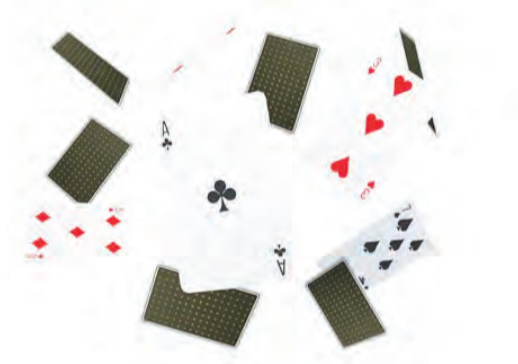
Das Jassturnier findet am 16. Januar statt.

Jassen Am Freitag, 16. Januar, um 14 Uhr findet im Alters- und Pflegezentrum Amriswil, an der Heimstrasse 15 ein öffentliches Jassturnier statt. Saalöffnung ist um 13.30 Uhr. Gespielt wird mit französischen Karten «Handjass zu dritt». Das Startgeld beträgt 10 Franken. Anmeldeschluss ist am Mittwoch, 14. Januar, beim Restaurant Egelmoos unter Telefonnummer 071 414 34 44. Die Organisierenden freuen sich über zahlreiche Teilnehmerinnen und Teilnehmer.