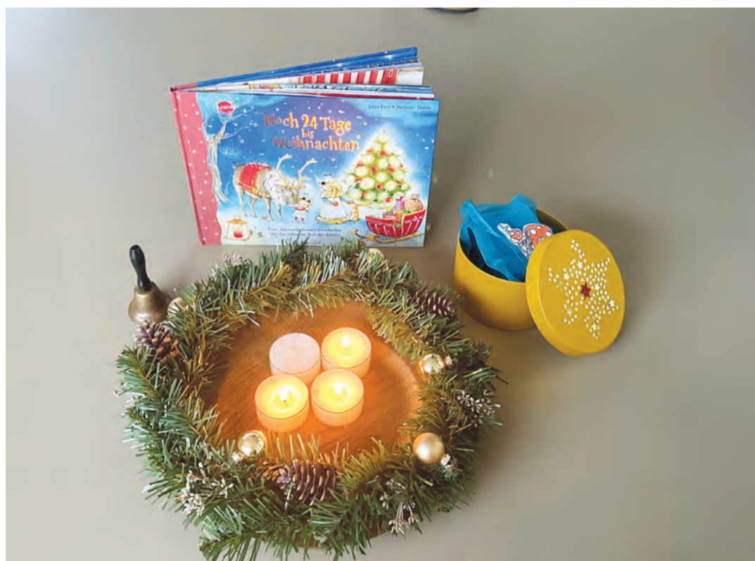
Natürlich darf auch eine vorweihnachtliche Geschichte im Kinderhaus Floh nicht fehlen.

Auf jeder Gruppe trafen sich die Kinder zu einem besonderen Adventsmorgenkreis. In der Gruppe Wirbelwind sangen sie gemeinsam ein fröhliches Lied, hörten eine spannende Geschichte und öffneten täglich die «Adventszauberbox», die ihnen verriet, welches Kind an diesem Tag das «Adventskind» sein durfte. Diese ruhige, liebevolle und aufregende Tradition begleitete die Grup-