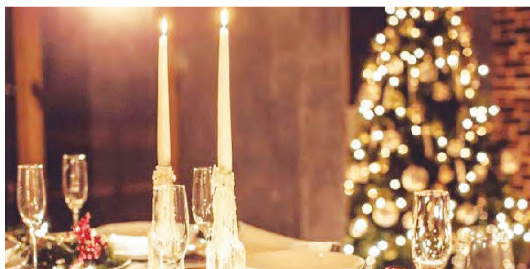
An Weihnachten und zu Neujahr werden im Restaurant Egelmoos festliche Menüs angeboten.

• Erster Weihnachtstag, 25. Dezember 2025: Vorspeise: Riesling-Silvanercrèmesuppe mit Zimtcroûtons Hauptgang: Schweinsfilet im Parmaschinkenmantel gefüllt mit Spinat und Feta, Cognacrahmsauce und Tomatenrisotto Dessert: Bratapfelcrème mit Mascarpone