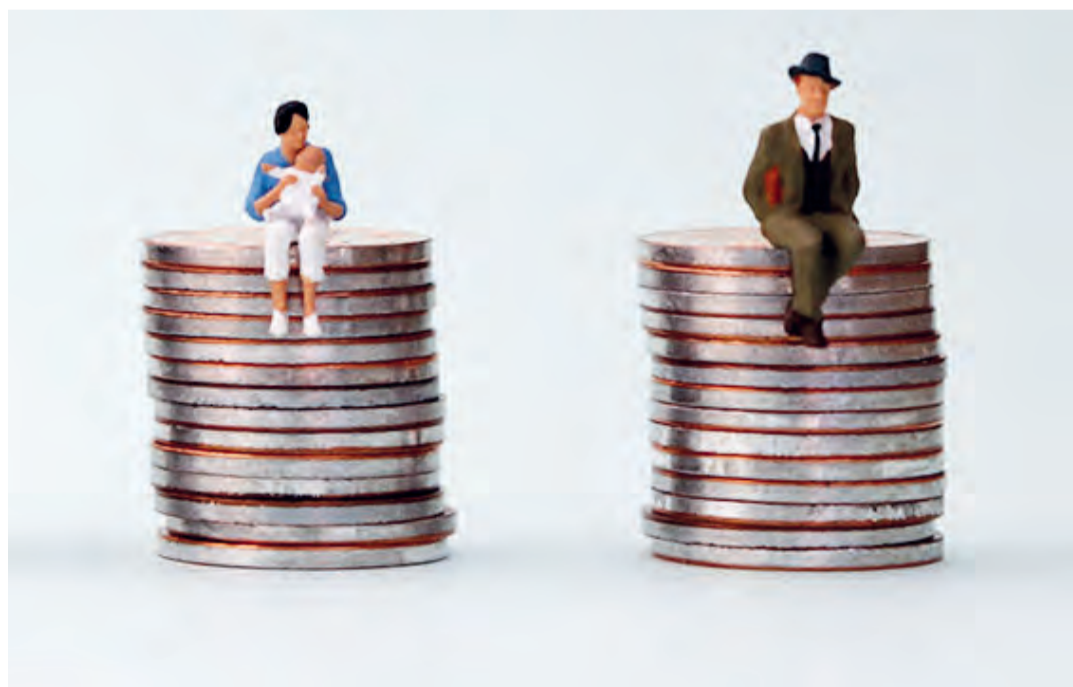
An der letzten Sitzung im Jahr entscheidet der Stadtrat jeweils über die Löhne des Personals.

Schon seit der Einführung des in Kraft stehenden Lohnreglements im Jahr 2004 hat die Behörde nicht mehr über Einzellöhne zu diskutieren. Deren Festsetzung obliegt für die Geschäftsleitung dem Stadtpräsi-