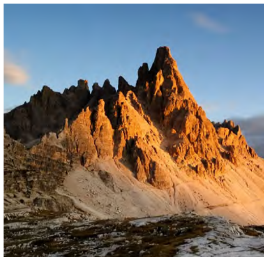
Im Vortrag geht es um die Dolomiten.