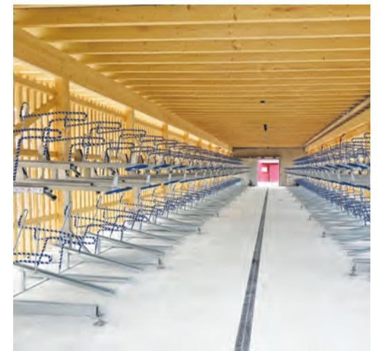
Innenansicht der neuen Veloparkierung.

Franken, Halbjahresabo 90 Franken, Jahresabo 120 Franken. Der Zutritt und die Nutzung der geschlossenen Veloparkierung soll nach einer vorgängigen Testphase ab Anfang Januar 2026 möglich sein. Die 128 Aussenabstellplätze bei der Velostation Ost und die 80 Plätze in der Veloabstellanlage West werden noch vor Weihnachten den Nutzerinnen und Nutzern übergeben. Insgesamt stehen nach der Neugestaltung des Bahnhofareals rund 500 gedeckte Veloabstellplätze, zirka 20 Abstellplätze für Roller und Mofas sowie zirka 32 Plätze für E-Scooter auf dem Bahnhofgelände zur Verfügung stehen. Die Anzahl der einzelnen Zweiräder kann, je nach Anordnung in den einzelnen Abstellanlagen, abweichen. Zum Vergleich: Heute stehen insgesamt rund 260 bis 270 gedeckte Veloabstellplätze zur Verfügung. Als weitere Dienstleistung können auf dem Bahnhofgelände bei der Velostation Ost sechs kleine und sieben grosse Schliessfächer gemietet werden. (red)