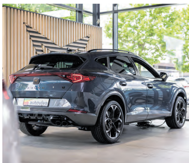
Den CUPRA Formentor gibt es aktuell zu Sonderkonditionen.