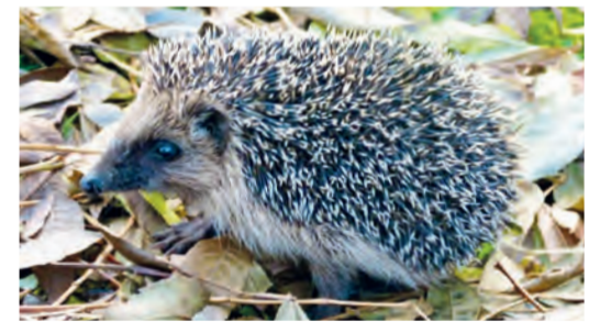
Am Sonntag stehen die Igel im Zentrum.