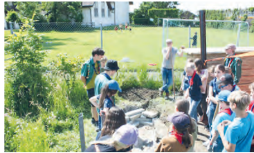
Die Pfadi hat eine Sumpflandschaft erstellt.

Pfadi Am Tag der Guten Tat hat eine Pfadistufe der Pfadi Amriswil im Schulmuseum eine Sumpflandschaft erstellt. Dabei hatten sie Unterstützung von Rutishauser Gartenbau. Die Kinder lernten ebenfalls etwas über die verschiedenen Pflanzen, welche es auf der Öko Wiese beim Schulmuseum gibt, dazu haben sie verschiedene Steckbriefe erstellt.