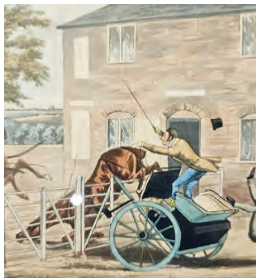
Ein grausamer Kutschenunfall.