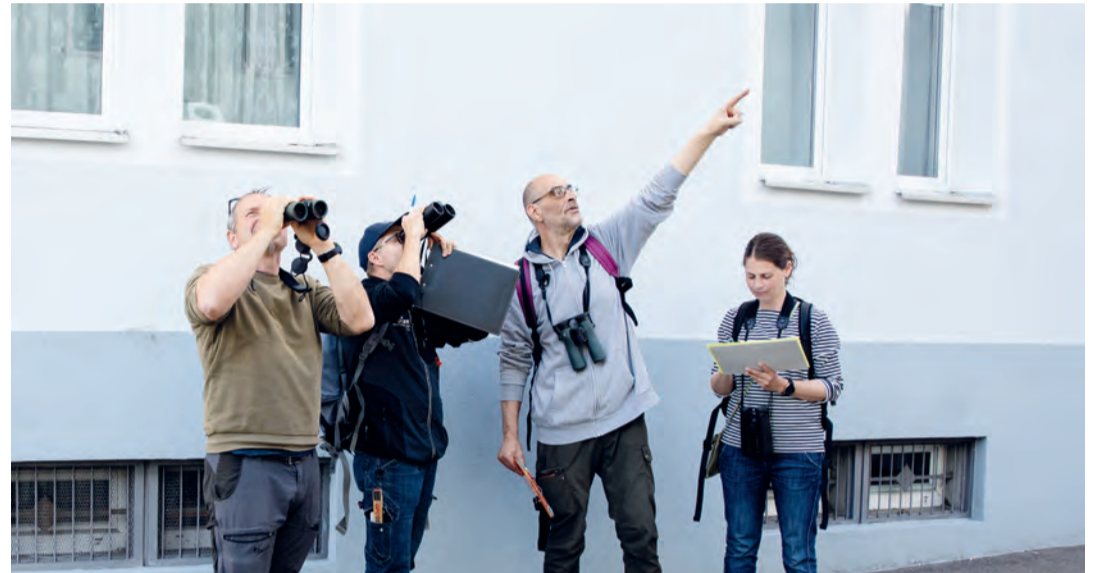
Der Natur- und Vogelschutzverein ist ab kommender Woche in Amriswil unterwegs.

Der Natur- und Vogelschutzverein Amriswil wird die Erhebung des ersten Teils unter der Leitung von Stephan Steger Ende Mai bis Juli durchführen. Es geht darum, Nester von Mauerseglern sowie Mehl- und Rauchschnalben zu erfassen. Dafür werden die Vogelschützerinnen und Vogelschützer die Ge-