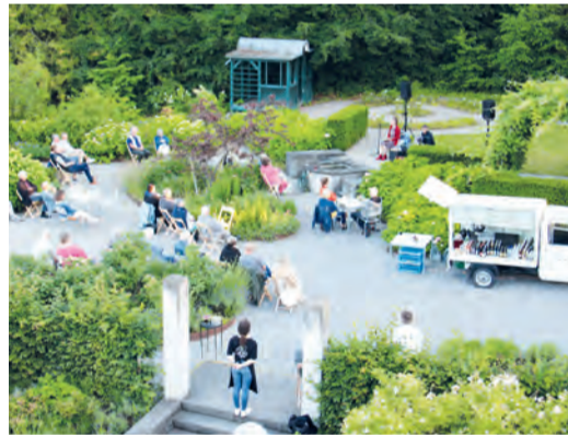
Das Konzert findet im Villa Garten statt.

kalischen und einfühlsamen Rhythmusgruppe mit Dusan Prusak am Kontrabass und Adi Gerlach am Schlagzeug. Das Konzert ist öffentlich und der Eintritt ist frei. Es gibt eine Kollekte, welche die Durchführung weiterer Konzerte ermöglicht. Die Sitzplätze sind begrenzt und nicht reservierbar. Für das leibliche Wohl sorgt das Bistro Cartonage. Bei Regen findet das Konzert im Kulturforum statt.