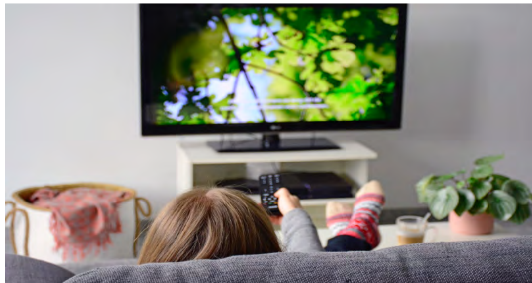
REA-Kundinnen und Kunden müssen am 4. Juni allenfalls ein Sendersuchlauf durchführen.

Die Regio Energie Amriswil (REA) und ihre Partnerin Sunrise setzen sich kontinuierlich dafür ein, ihre Produkte zu optimieren und auf die Bedürfnisse ihrer Kundschaft einzugehen. Aus diesem Grund findet am Dienstag, 4. Juni, auf dem Kabelnetz der REA ein Frequenzwechsel der TV-Sender statt. Wichtig – Am 4. Juni ist bei einigen TV-Geräten dadurch ein manueller Sendersuchlauf notwendig. Denn durch den Frequenzwechsel kann sich die Reihenfolge der Programme im Grundangebot «REA Connect Basic»