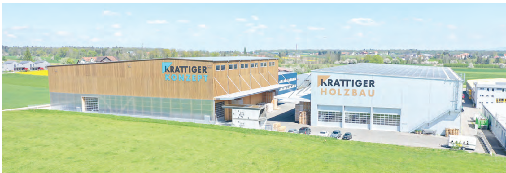
Die Krattiger Holzbau AG ist ein Plus-Energie-Betrieb und produziert mit der Photovoltaik-Anlage mehr Strom, als tatsächlich an Energie gebraucht wird.

Energiestadt In einer neuen Energiestadt-Artikelserie werden wöchentlich Unternehmen aus Amriswil zu den Themen Nachhaltigkeit und Energieeffizienz befragt. Den Anfang macht die Krattiger Holzbau AG.