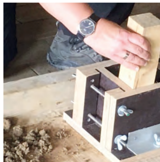
Lehm stampfen und formen braucht Geduld.

Schulmuseum Am Museumssonntag, 2. Juni, stampfen und formen Besucher im Schulmuseum Thurgau in Amriswil zwischen 14 und 16.30 Uhr dekorative Lehmwürfel aus Stampflehm. Unter dem Sonnensegel im Garten, direkt neben der neuen Stampflehm-mauer, liegen das Lehmgemisch, das Vierkantholz und die Stampflehmbox bereit. Interessierte erfahren alles zur Tradition des Stampflehms und dessen Verwendung als Baustoff. Gleichzeitig können alle ihren eigenen Lehmziegel in der Form eines Würfels herstellen. Alle Hobby-Maurer haben die Wahl, die Ziegel mit nach Hause zu nehmen oder aber im Schulmuseum zu lassen. Dort entstehen mit Lehmziegeln weitere wertvolle Lehm-mauern im biodiversen Lerngarten. Sie sind Lebensräume auch für Bienen und nützliche Insekten, weitere Lebewesen und Pflanzen. Wer genug gemauert hat, kann sich im alten Schulhaus Mühlebach, das 1846 aus Stampflehm erbaut worden ist, an der Sonderausstellung zum Lehm-bau noch weiter mit dem ökologisch wertvollen Baustoff befassen. Das Museumscafé hat ebenfalls ge-