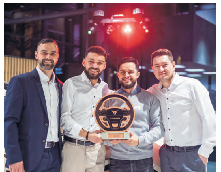
Das CUPRA-Sales- und After-Sales-Team der Autoviva.

Aktuell bietet CUPRA zwei Sondermodelle vom Born und vom Formentor – die Sensacion-Editionen – zu Vorzugskonditionen von bis zu 8550 Franken Rabatt und 0,99 % Leasing an. Diese Aktion läuft bis Ende Juni. Das nächste grosse Highlight wird der CUPRA Tavascan, das erste vollelektrische SUV-Coupé von CUPRA mit bis zu 550 km Reichweite. Das Modell ist ab Juli 2024 bei Autoviva bestellbar.