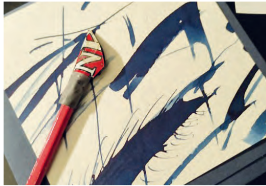
Die kleinen Kunstwerke mit der Colafeder.