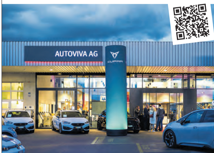
Die Autoviva AG hat ihren CUPRA-Showroom eröffnet und bietet vier Jahre kostenlosen Service beim Kauf eines CUPRA.

Autoviva AG Kreuzlingerstrasse 30 8580 Amriswil www.autoviva.ch