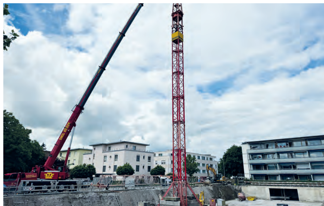
Der Kran für die Ausführung der Hochbauarbeiten wurde am Dienstag geliefert.

Die Aushubarbeiten des Neubaus von 31 Alterswohnungen sind abgeschlossen. Am Dienstag wurde der Kran gestellt, sodass der Hochbau in den kommenden Monaten erfolgen kann. Bislang wurden über 650 Lastwagen an Aushubmaterialien abgeführt. Dabei wurden trotz geologischem Gutachten und Messungen mehr Inertmaterialien und Torf gefunden, als erwartet, was höhere Deponiekosten zur Folge hatte. Diese bewegen sich aber nach wie vor im Rahmen des Baukredits. Auch gibt es weiterhin keine Verzögerungen im Terminplan und es läuft alles im zeitlichen Rahmen. Bis im Herbst werden durch die Firma Stutz AG nun das Untergeschoss, das Erdgeschoss sowie der Gebäudekern mit