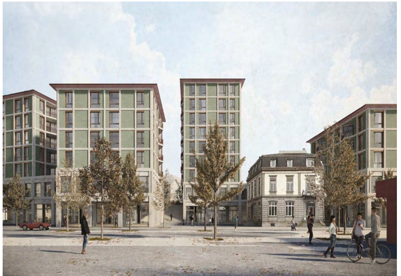
Das Projekt «Portobello» stammt vom Architektenteam Bauer Allemann Eigenmann Architekten, Zürich, und Mettler Landschaftsarchitektur, Gossau/Berlin.

erhalten. Sämtliche übrige Bauten im Planungsgebiet müssen zurückgebaut werden.