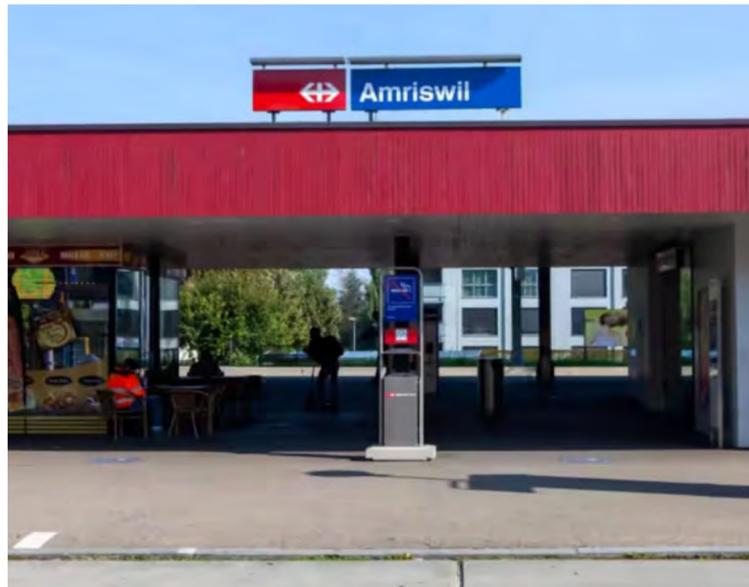
Der Stadtrat sichert die Patrouillen der Security-Mitarbeiter noch mindestens bis Ende März.

Am Round-Table mit allen Beteiligten erläuterte die SBB-Transportpolizei ihre eigenen Erfahrungen und Einschätzungen der Situation am Amriswiler Bahnhof. Demnach haben sich in den ersten zehn Monaten des Jahres 2023 beim Bahnhof Amriswil bereits knapp viermal mehr Delikte als im Jahr zuvor ereignet. Rund die Hälfte der registrierten Vorfälle betreffen Verstösse gegen die Hausordnung sowie Meldungen im Bereich der Betriebslage. Zudem, erklärte die Transportpolizei, seien im Jahr 2022 viermal mehr Strafanzeigen im Bahnumfeld registriert worden als im Jahr zuvor. Auch für das laufende Jahr liege bereits jetzt eine Zunahme von 27 Prozent vor. Vermögensdelikte machen heuer 74 Prozent aller Strafanzeigen im Bahnumfeld aus. Zudem sind sie im Vergleich zum Vorjahr um einen Viertel angestiegen. Den stärksten Anstieg verzeichnen die Betäubungsmitteldelikte. Hier wurden bereits jetzt siebenmal mehr Strafanzeigen