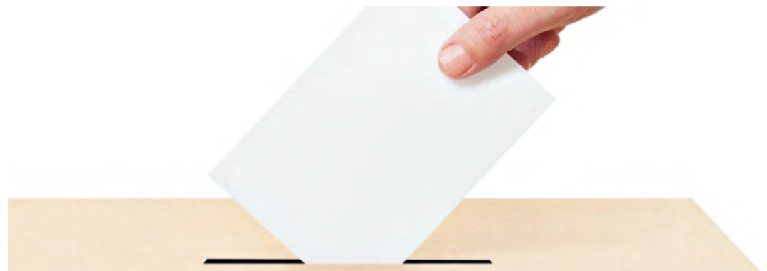
Die Urne im Stadthaus wird ab Juni 2024 nur noch am Abstimmungssonntag geöffnet sein.

Die grosse Mehrheit der Stimmberechtigten gibt bei Wahlen und Abstimmungen die Stimme heute brieflich ab. In Amriswil sind dies mittlerweile rund 95 Prozent jener Personen, die sich an den Urnengängen beteiligen. Entsprechend tief ist die Anzahl von Stimmberechtigten geworden, die noch persönlich an der Urne erscheinen. Weil mit der Beliebtheit der brieflichen Stimmabgabe die Arbeit der Urnenoffizianten abgenommen hat und kaum noch Personen an der Urne erschienen sind, hat der Stadtrat die ehemals bestehenden Urnenstandorte in Rächlisberg, Hagwil, Oberaach, Biessenhofen und Schocherswil schon 2016 aufgehoben und die heute noch geltenden Urnenöffnungszeiten eingeführt. Diese sind an den Abstimmungswochenenden jeweils freitags von 17.30 bis 19 Uhr, am Samstag von 10.30 bis 11.30 Uhr und am eigentlichen Abstimmungssonntag von 10 bis 11.30 Uhr. In der Zwischenzeit hat sich das Verhältnis zwischen den brieflich und den an der Urne abgegebenen Stimmen weiter in Richtung der brieflichen Stimmabgabe verschoben. Ein Tiefpunkt wurde am Abstimmungswochenende vom 26. November 2023 erreicht, als am Freitag nur gerade fünf und am Samstag gar nur drei Personen an der Urne erschienen.