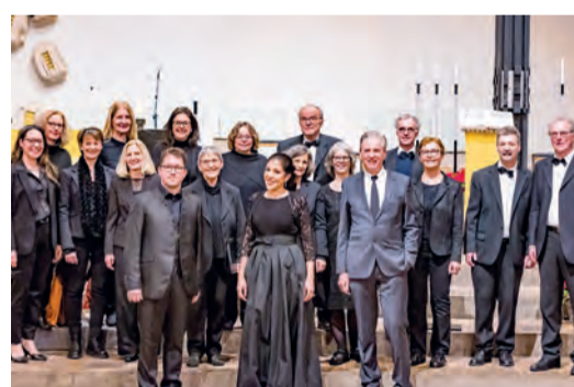
Die Amriswiler Konzerte laden zum Konzert.