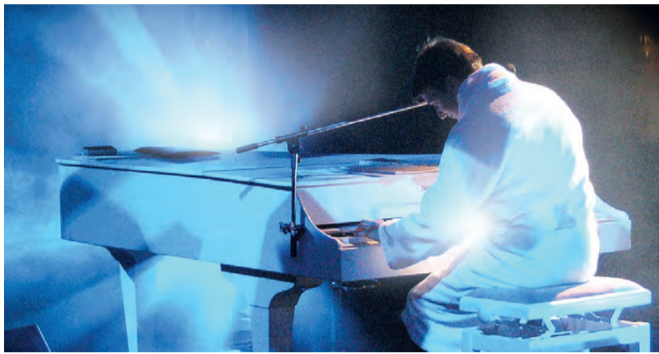
Am 20. Januar werden im Pentorama die grössten Udo Jürgens-Hits präsentiert.

Musik Die schönsten Lieder des bekannten Musikers und Sängers, präsentiert von SahneMixx im Pentorama in Amriswil.