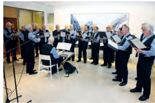
Die Aachsänger zu Gast im Spital Münsterlingen.

Gedanken an die Weihnachtszeit. Danach folgten weitere Lieder wie etwa «O du stille Zeit», «Schenke uns Frieden», und gemeinsam mit den Zuhörern ertönte in den Hallen des Spitals «Stille Nacht, Heilige Nacht». Abgeschlossen wurde der Auftritt der Aachsänger im «Nonnenpförtli»-Restaurant.