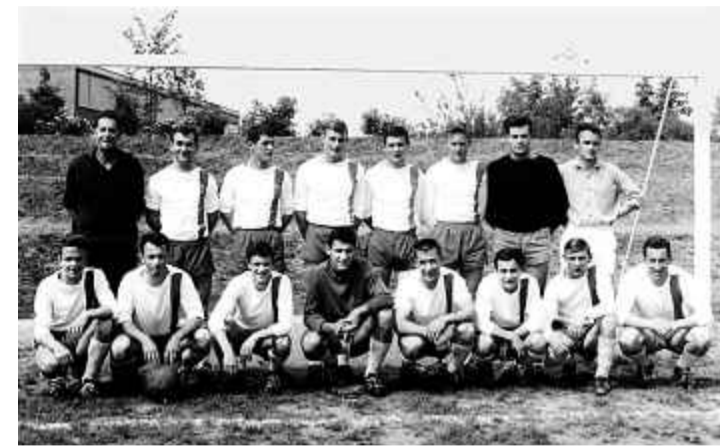
1963: Der FCA kassiert eine skandalöse Forfait-Niederlage.

Ob es am 15. September an der Tageskasse noch Tickets für das Cupspiel gegen den FC Basel geben wird, ist nicht sicher. Von den 4816 Plätzen (maximale Kapazität des Tellenfelds) sind über 4000 bereits verkauft. Besonders gross war der Ansturm auf die 1016 Sitz- plätze. Diese waren eine Stunde nach Eröffnung des Vorverkaufs weg. Aktuell sind nur noch wenige hundert Stehplätze verfügbar. Der Vorverkauf läuft über den Ticketcorner (www.ticketcorner.ch)