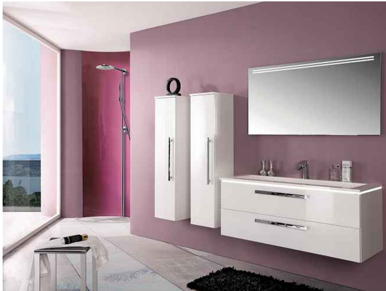
Paris-Badzimmer zeichnen sich durch das moderne Dessin und Funktionalität aus.