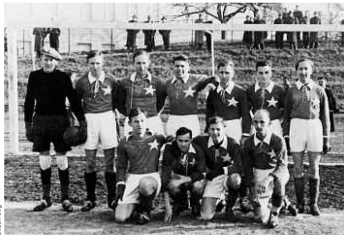
24. Dezember 1944: Die Amriswil-Elf tritt gegen Locarno an.