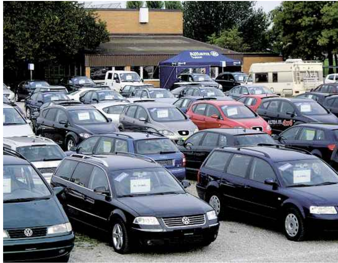
Auf dem Sportplatz Amriswil wird eine grosse Bandbreite an Occasions-Fahrzeugen präsentiert.

In den letzten Monaten wurde sehr viel über den Automarkt und die Preise geschrieben und diskutiert. Die ausgleichenden Massnahmen zwischen den Märkten machen den Kauf eines Fahrzeuges hoch interessant. Die verschiedenen Bonussysteme von diversen Anbietern wirken sich auch auf die Preise der Gebrauchtwagen aus, ganz zum Wohle des interessierten Käufers.