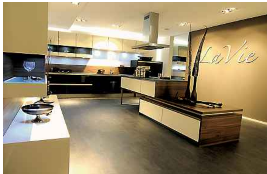
Funktionell und speziell – jede Wunschküche ist beim Arboner Spezialisten MB Küchen & Bäder zu haben.