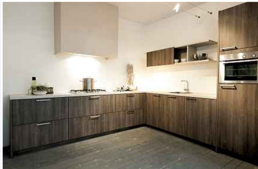
Rotpunkt-Küchen sind erhältlich in Fournierholzfronten und farbig lackierten Fournierholzfronten in verschiedenen Holzausführungen.